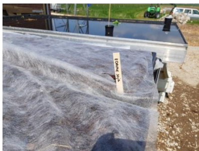
Edame soja bonen