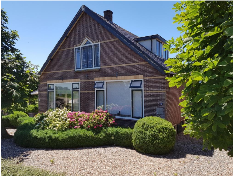
De Lindenhorst, de Hoef

Op zaterdag 9 juli hebben we de eerste uitgifte van een (rond)vleespakket. Hoewel het nog niet afkomstig is van een koe die op ons land geleefd heeft ben ik er toch trots op. Het vlees is afkomstig van een koe van een prachtige biologische boerderij: De Lindenhorst in de Hoef.