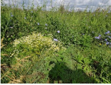
Foto Omslag: voor de één een walhalla voor de ander een nachtmerrie. Veld met wilde plantenen doorgeschoten groenten.