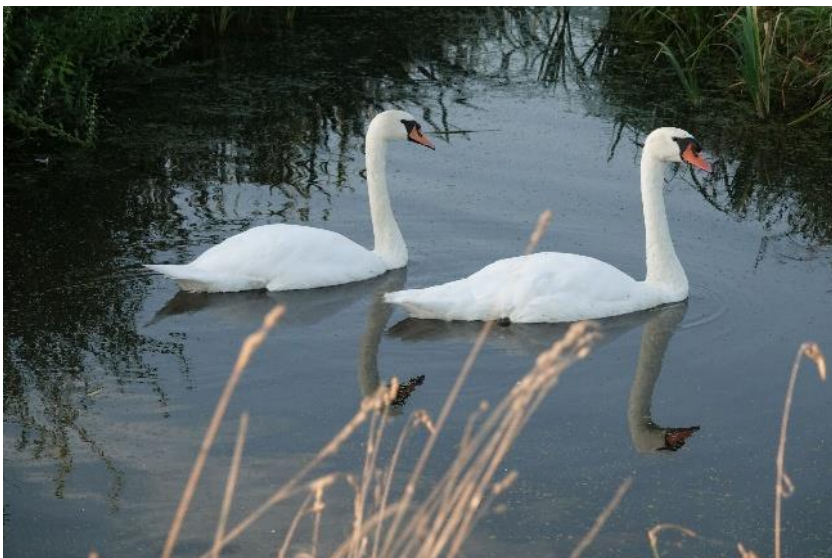
knobbelzwanen in de grote tocht