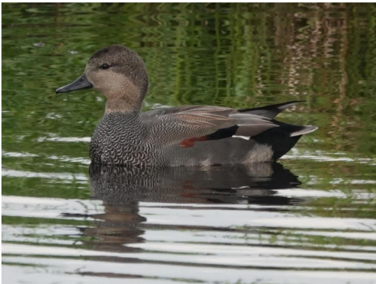
Kraakeend (man) als de mist is opgetrokken

Krakeenden zie je steeds meer in Nederland; op sommige plaatsen bijna net zoveel als wilde eenden. Vrouwtje krakeenden en vrouwtjes wilde eenden lijken op elkaar. De vrouwen krakeenden hebben een witte spiegel en een zwarte kont, wilde eenden hebben een blauwe spiegel (de vrouwtjes).