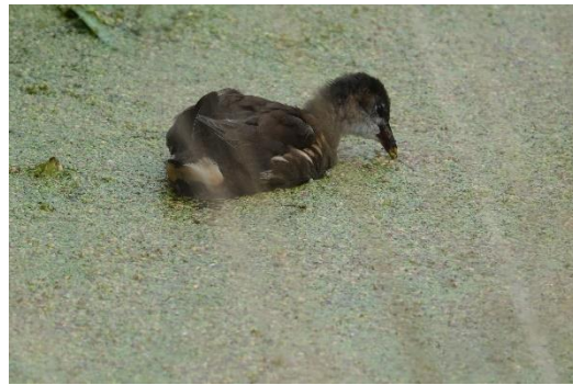
jong waterhoen in een van de kleine slotjes