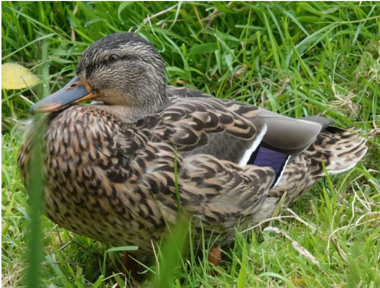
Wilde eend (vrouw) met blauwe spiegel