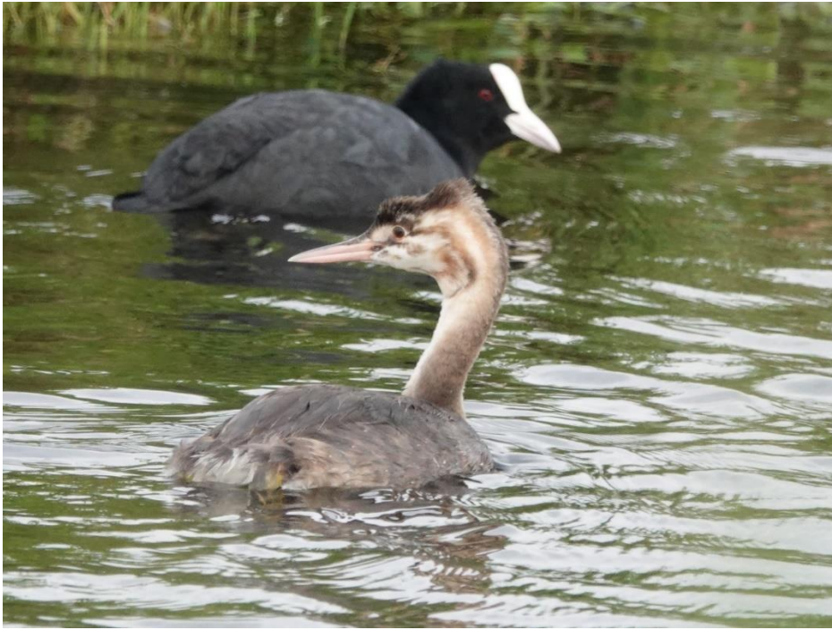
Bijna volwassen fuut in winterkleed met voorbij zwemmende meerkoet