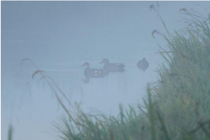
krakeenden in de ochtendmist in de grote tocht bij de tweede brug