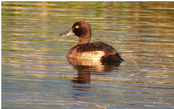
kuifeend (vrouw) in de grote tocht