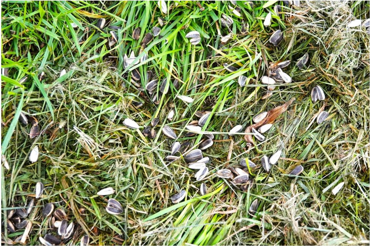
Wat op de grond valt, is voor de houtduiven.